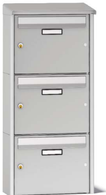
Opretstående, vertikal brevkasse. Bredde 418 mm.

SONO Brevkasseanlæg findes både i opretstående (vertikal) og vandretliggende (horisontal) udførelse og i mange forskellige størrelser og modeller. De er konstruerede til montage på væg med monteringshuller på bagsiden. Brevkasserne produceres i pulverlakeret stålplade med bukkede kanter der skaber ekstra stabilitet. Leveres som standard i grå, hvid og sort, men kan også leveres i andre farver.